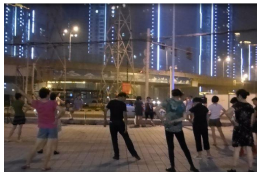
参考1 広場舞(中国各地) 中高年女性を中心に、リーダーがダンスを指導して屋外で夜踊る。ディスコとエアロビクス、ラジオ体操を足して3で割ったようなもの。

上海や北京など中国各地で毎晩のように空き地や公園で繰り広げられている「広場舞」。“おばさんダンス”とも呼ばれ、多くの人が集まっています。団体ではなく、自然発生的に集まっているそうです。その日本版 = 「和」のダンスを作っていきましょう。広場舞は指導役に向かって整列して踊りますが、盆踊りのように「輪」になって踊ることで、序列のない平等なコミュニティを目指します。