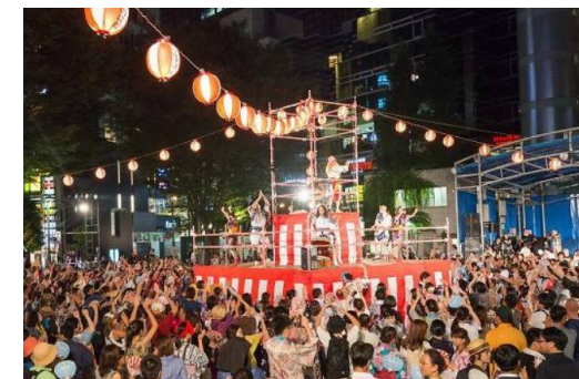
参考2 にゅ〜盆踊り(豊島区) フォークダンスのように相手が代わっていく盆踊り。参加者は当日自由参加。踊りの手本を示すリーダーを事前のワークショップで育成。約5,000人を集客。